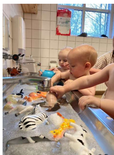
Fordybet i vandleg.