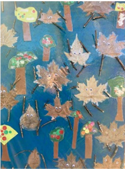
Her er børnehavebørns kunstværk efter projekt fra jord til bord. Der er brugt materialer fra temaforløbet.