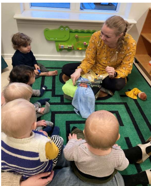
Meget opmærksomme børn-Samling i vuggestuen.