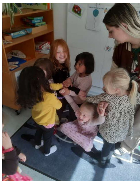
Fri for mobberi-Kluddermor i børnehaven.