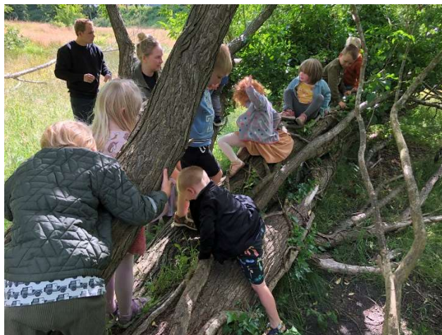
Musik i vuggestuen-hvad er der mon i posen? Børnehaven på opdagelse i naturen.