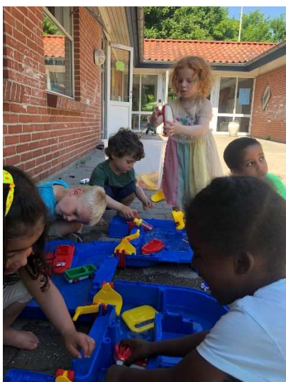
Fordybet i vandleg.